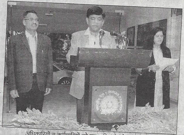
अधिकारियों व कर्मचारियों को शपथ दिलाते कोर महाप्रबन्धक

प्रयागराज। भारतीय संविधान को दिनांक 26 नवम्बर 1949 को अंगीकृत करने के उपलक्ष्य में मंगलवार को कोर मुख्यालय इलाहाबाद में संविधान दिवस मनाया गया। जिसमें अधिकारियों एवं कर्मचारियों को 11 बजे महाप्रबन्धक कोर द्वारा संविधान की उद्देशिका की शपथ दिलाई गई। महाप्रबन्धक महोदय की अध्यक्षता में ही कोर कार्यालय के पंचशील प्रेक्षागृह में अधिकारियों के मध्य बैठक का आयोजन किया गया तथा आरोही प्रेक्षागृह में समय 16.30 बजे उद्देशिका भारतीय संविधान की आत्मा विषय पर संगोष्ठी का सफल