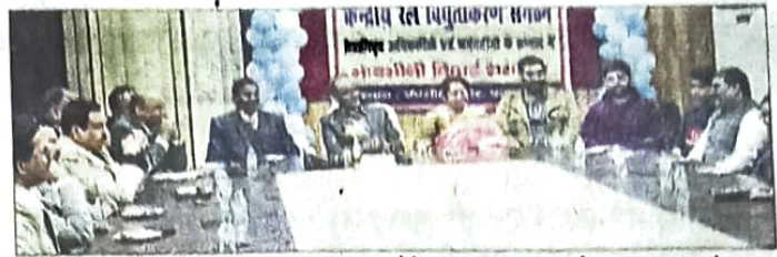
विद्युतीकरण संगठन ने अपना 68वां रेल सप्ताह समारोह मनाया। संवाद

समारोह में उप मुख्य विद्युत अभियंता, रेल विद्युतीकरण तुलजप